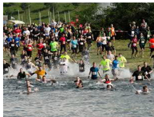
Sparkassen Cross de Luxe , Quelle: Sportfreunde Neuseenland e.V. / Wittig

Wer keinen Startplatz ergattert hat, der kann mit etwas Glück für die vier 9 km Slots am Sonntag vor Ort einen Startplatz ergattern. Am besten eine gute Stunde vor Start im OrgBüro melden und nachfragen. Der Tradition gemäß gibt es auch in diesem Jahr wieder eine stylische Finisher-Medaille, leckere Sternquell Bierbrause und erfrischende Getränke von Lichtenauer. Für die Fotoaktion #cdltattoo werden am Samstag und Sonntag rund 2000 CrossDeLuxe Tattoos von den AOK PLUS Promotern verteilt. Mit etwas Glück kann man mit seinem Tattoo-Selfie attraktive