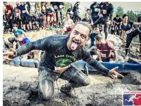
Sparkassen-CrossDeLuxe 2018, Foto: sportograf.com

Der Sparkassen-CrossDeLuxe ließ Sportlerherzen von Samstag bis Sonntag höherschlagen. Bei angenehmen Temperaturen und viel Sonnenschein stellten sich über 4.000 schlammbegeisterte Läufer den abenteuerlichen 29 natürlichen und künstlichen Hindernissen entlang des Markkleeberger Sees.